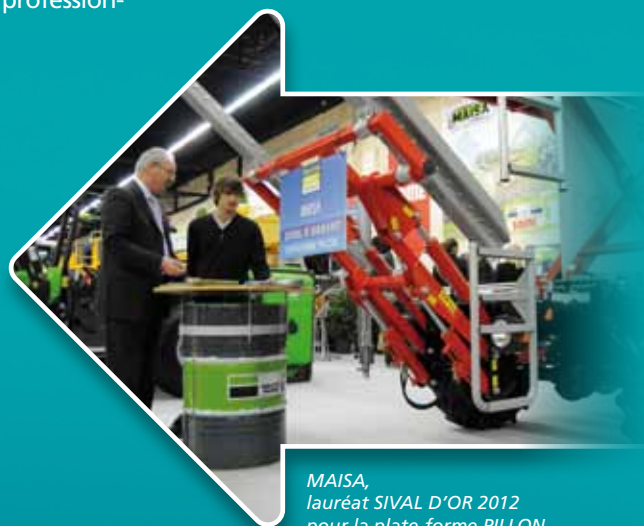
MAISA, lauréat SIVAL D'OR 2012 pour la plate-forme PILLON

Hub SIVAL : solutions pour des productions végétales performantes et durables.